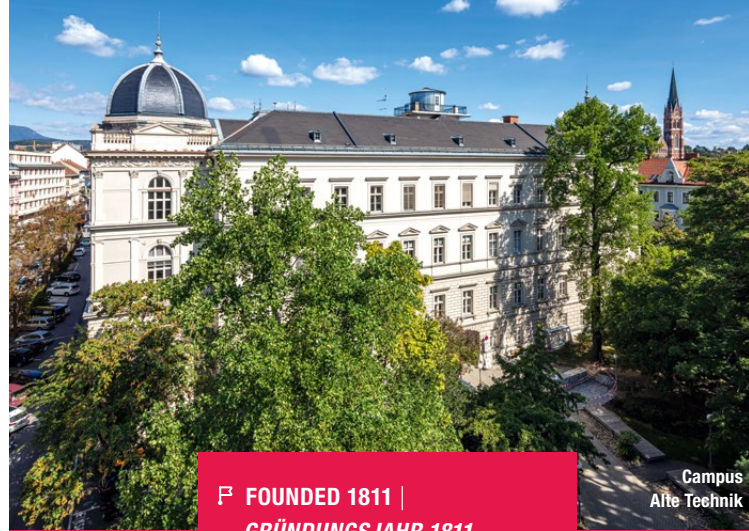
Campus Alte Technik