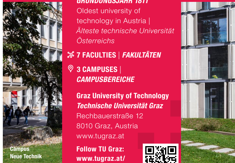
Campus Neue Technik